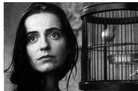
Vale Abraão de Manoel de Oliveira