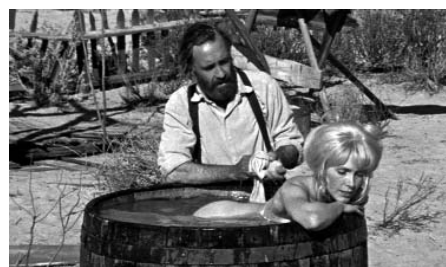
The Ballad of Cable Hogue de Sam Peckinpah

Considerat un dels gèneres cinematogràfics per excel·lència, el western s'ha anat adaptant morfològicament al pas del temps. Del testimoni gairebé documental dels primers anys—recordem que el mateix Buffalo Bill va intervenir com a actor cinematogràfic en algunes pel·lícules sobre la seva vida—, el western evolucionà després a epopeies evidentment manipuladores de la gran aventura de l'Oest. Així va néixer tota una mitologia que, de Tom Mix a John Wayne, enlluernà durant molts anys uns espectadors tan àvids d'aventures i acció com exigents en el respecte a les inevitables tipologies dels indis, els cowboys, el setè de cavalleria, els duels a revòlver o les galopades de búfals. Amb els anys seixanta, quan canvià la tipologia de l'espectador cinematogràfic a favor d'un públic més juvenil i contestatari, el western varià totalment aquestes claus i dels uniformes impecables, els galans ben pentinats o el folklore dels indis, el nou western derivà vers unes noves tipologies que es volien més realistes. Mestres com John Ford adoptaren també aquesta tendència amb films com L'HOMME QUE VA MATAR LIBERTY VALANCE , però seria sens dubte Sam Peckinpah qui establiria les noves pautes de tractament del gènere. Ell mateix d'origen pell roja, Peckinpah va néixer el 1926. La seva carrera artística comença al teatre i treballa després a la televisió, on fa de guionista i director de serials televisius. Acecedeix a Hollywood com a ajudant de direcció i, finalment, com a director especialit-