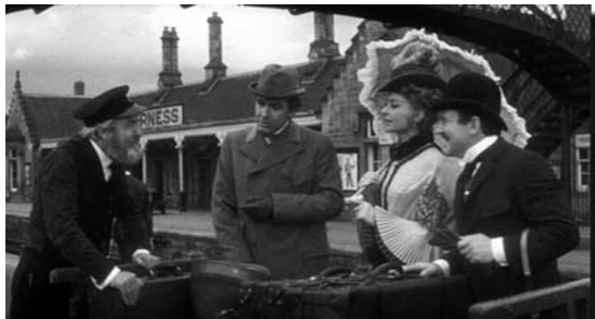
The Private Life of Sherlock Holmes de Billy Wilder