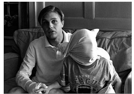
Funny Games de Michael Haneke (versió 2007)